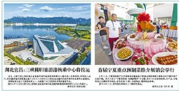
湖北宜昌：三峡移民旅游港换乘中心将投运

随着社会经济高速发展，人们对美好生活的物质追求越来越高，汽车已成为每家每户必备的出行代步工具，且不单追求家中有车，还要追求名牌豪车。但是若有卖主声称出售的豪车为“抵押车辆”不能登记过户，但车况不错不影响使用，你愿意用“白菜价”买到吗？