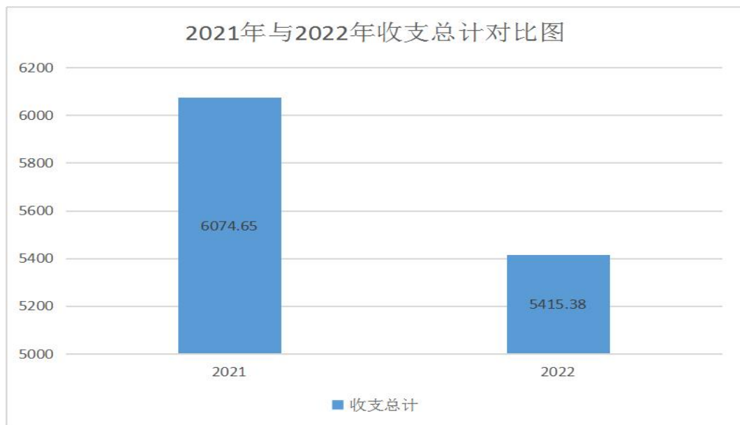
图 1：2021 年与 2022 年收支总计对比情况图

本部门 2022 年度收、支总计（含结转和结余）5415.38 万元。与 2021 年度决算相比，收入减少 329.63 万元，下降 10.85%，主要原因是主要是本年度无上年度结转资金，且因资金紧张，部分项目终止，未拨款，导致收入减少。支出减少 329.63 万元，下降 10.85%，主要原因是本年度无上年度结转资金，依照本年度年初预算进行资金支出，因项目施展进度问题，部分项目终止，未能支付，导致支出减少。