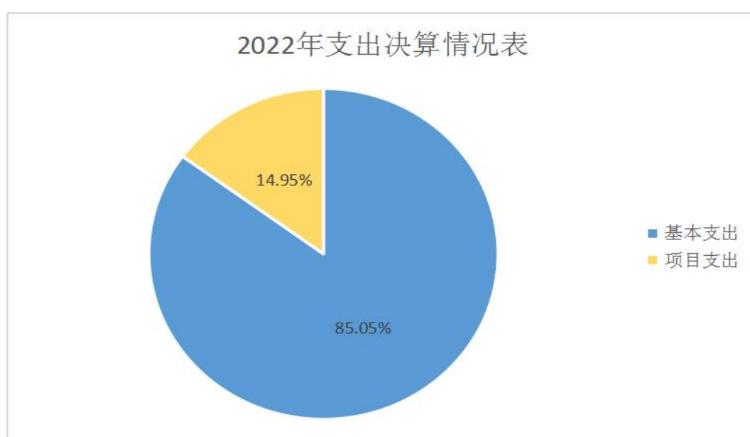
图 2：2022 年支出决算情况图

本部门2022年度支出合计2707.69万元，其中：基本支出2302.82万元，占85.05%；项目支出404.88万元，占14.95%；经营支出0万元，占0%；对附属单位补助支出0万元，占0%。