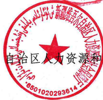
自治区人力资源和社会保障厅