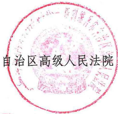
自治区高级人民法院

根据《国务院关于进一步优化政务服务提升行政效能推动“高效办成一件事”的指导意见》（国发〔2024〕3号）要求，为推进企业破产信息核查“一件事”工作，自治区高级人民法院会同配合部门，按照“一件事一个专班、一件事一个方案”要求，制定了《自治区高效办成企业破产信息核查“一件事”业务工作方案》，现印发你们，请结合实际，认真贯彻执行。