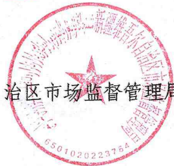
自治区市场监督管理局