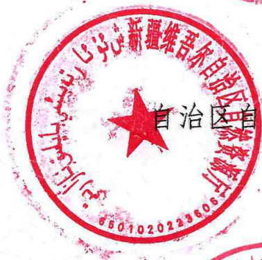
自治区自然资源厅